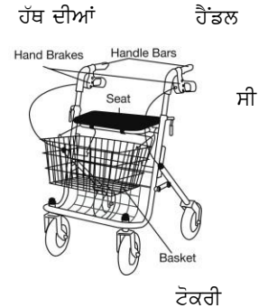
ਚਿੱਤਰ 1

4 ਪਹੀਆਂ ਵਾਲੇ ਵਾਕਰ ਵਿੱਚ ਆਮ ਤੌਰ ਤੇ ਇੱਕ ਸੀਟ, ਪਾਉਚ ਜਾਂ ਟੋਕਰੀ ਹੁੰਦੀ ਹੈ ਅਤੇ ਬ੍ਰੇਕਾਂ ਨੂੰ ਤੁਸੀਂ ਹੱਥਾਂ ਨਾਲ ਸੰਚਾਲਿਤ ਕਰਨਾ ਹੁੰਦਾ ਹੈ (ਚਿੱਤਰ 1 ਦੇਖੋ)। ਉਹ ਸਟੋਰ ਕਰਨ ਜਾਂ ਯਾਤਰਾ ਕਰਨ ਲਈ ਫੋਲਡ ਵੀ ਹੋ ਜਾਂਦੀਆਂ ਹਨ।