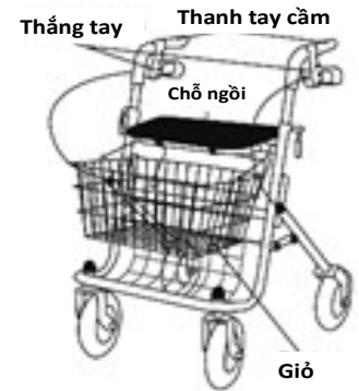
Hình 1 Hình minh họa từ redcross.ca

Khung tập đi 4 bánh xe thường có chỗ ngồi, túi nhỏ hoặc giỏ và thẳng để quý vị sử dụng bằng tay (xem hình 1). Chúng cũng gấp xuống để giữ đồ hoặc đi lại.